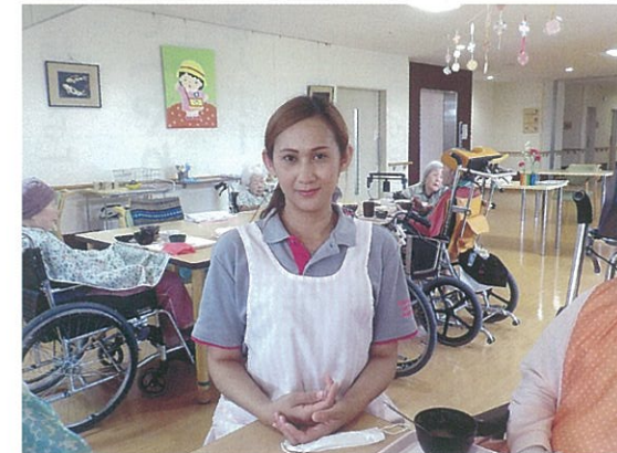
食事介助をしている途中で撮った一枚。姿勢よくポーズを決めてくれました。

を対象に、キャリアアップの為に研修を行って身につけるOJTと、座学を中心としたOFF J-Tを組み合わせることで人材育成に取組んでいるところです。一緒に働く仲間として、外国の方も増えてきました。文化の違いや、言葉のハンデもありますが、皆さんいつも笑顔で頑張っています。漢字表記の上にもローマ字を書くなど、不安なく働いてもらえるように協力しながら、ご利用者に穏やかな生活を提供するという同じ目標を持ってケアに取り組んでいます。