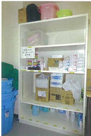
洗濯室の棚。物品の分類ごとに置く場所にラベルを貼って明記しています。