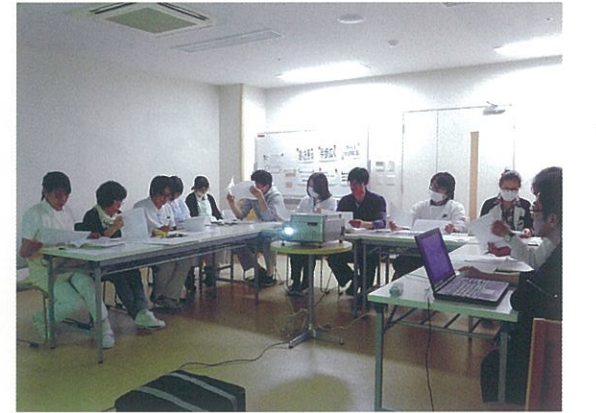
事例発表の様子。管理者である施設長や、介護員、看護師、管理栄養士といった様々な職種が集まります。