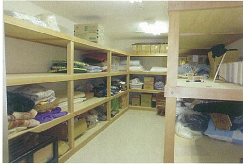
特養の倉庫。不必要なものを捨て、十分なスペースを確保しました。必要なものがすぐに取り出せるようになりました。