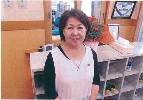
アンジェリカ保育園 園長

私はアンジェリカ保育園が大好きです。皆様にも、そう言って頂けるような保育園を目指していきたいと思えます。また、保育園だけでなく法人内の様々な施設と連携し交流を深めてまいりたいと思っております。そして地域にしっかりと根を張れるように保育園から情報を発信しコミュニケーションをとっていききたいと思えます。 最後に園に関わる皆様が元気に明るく笑顔で過ごせます様に職員一同がんばります。