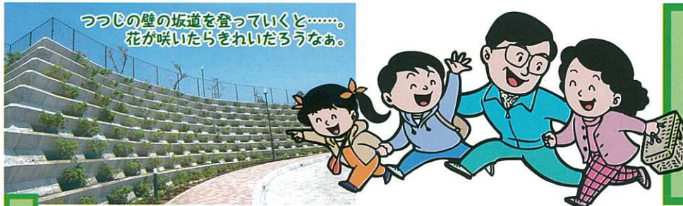
つつじの壁の坂道を登っていくと……。花が咲いたらきれいだろうなあ。

千葉県我孫子市布佐1559-2 Tel.04(7189)5201・Fax.04(7189)5203