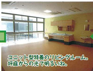
ユニット型特養のリビングルーム。坪庭からの光で明るいね。