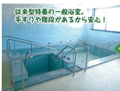
従来型特養の一般浴室。手すりや階段があるから安心!