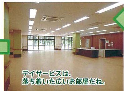
ティサービスは、落ち着いた広いお部屋だわ。