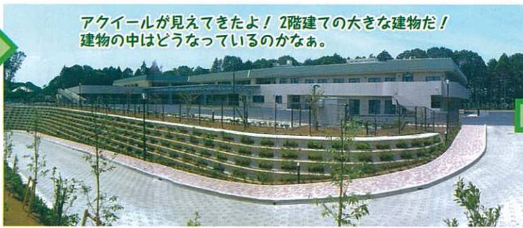
アクイールが見えてきたよ! 2階建ての大きな建物だ! 建物の中はどうなっているのかなあ。