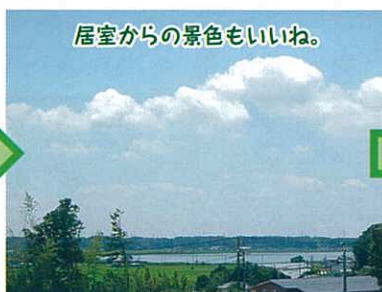
居室からの景色もいいね。