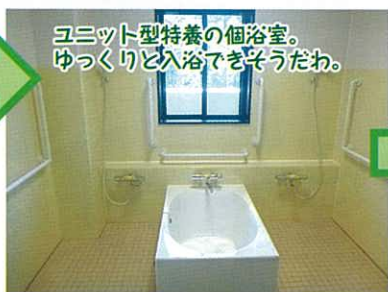
ユニット型特養の個室。ゆっくりと入浴できそうだな。