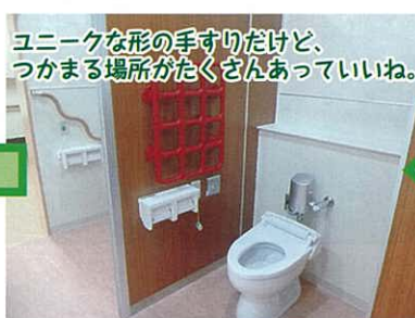
ユニークな形の手すりだけど、つかまる場所がたくさんあっていいね。