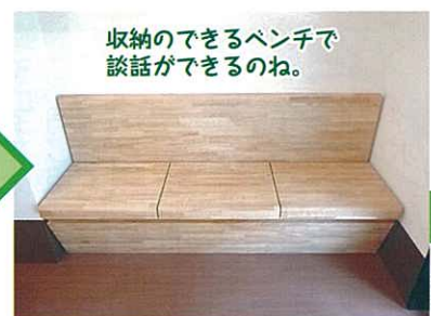
収納のできるベンチで談話ができるのね。