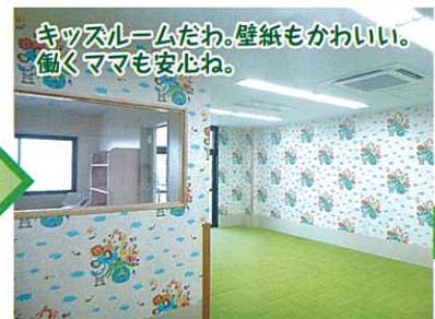
キッズルームだわ。壁紙もかわいい。働くママも安心ね。