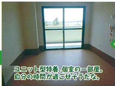
ユニット型特養、個室の一部屋。自分の時間が過ぎてそうだな。