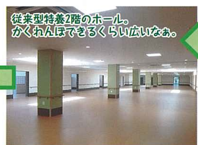
従来型特養2階のホール。かくれんぼできるくらい広いなあ。