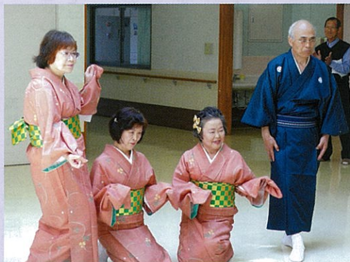
◀ 日本舞踊も披露していただきました。手拍子リズムをとっていただけました。いらっしゃいました。