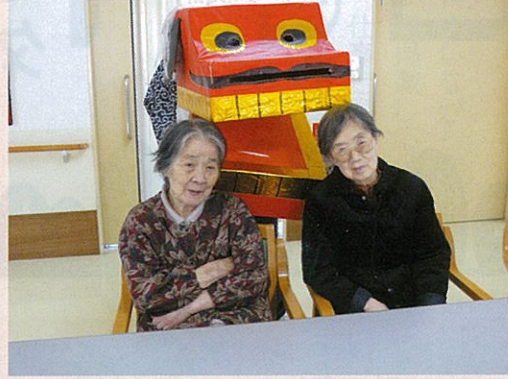
◀ 獅子舞が頭からガブリ！今年も元気で過ごせますように…。