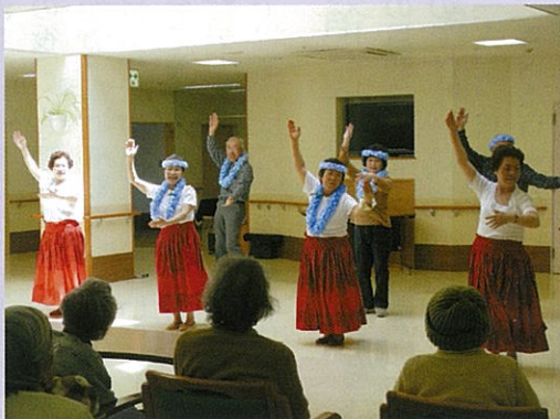
◀ 華やかなフラダンス！きれいに揃ってましたね。練習を重ねてきた様子が伺えました。