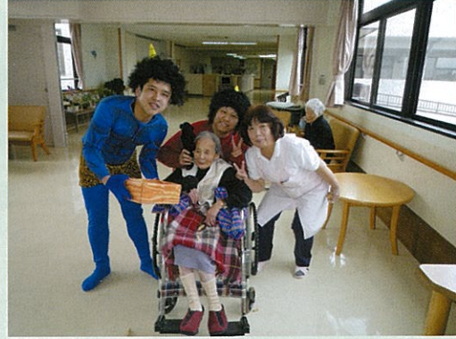
◀ 鬼役の職員と一緒にポーズ！皆さん優しいから鬼に向かって豆を投げないんですね。