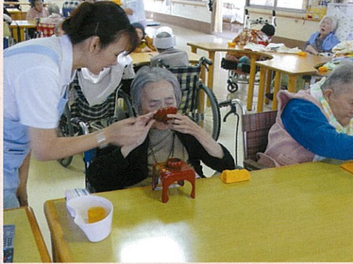
◀ 皆さんに御屠蘇をお配りしました。「もつと飲みたいっ」と笑顔で言った方もいらっしゃいました。