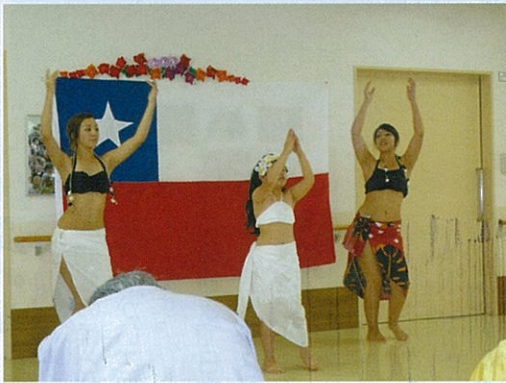
◀ セクシーな衣装でチリの伝統的な踊りを披露してくれました。独特な動きと音楽に皆さん真剣に見入っている様子です。