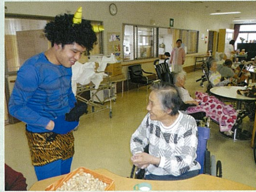
◀ いつもと違う職員の姿にびっくりしちゃいました。