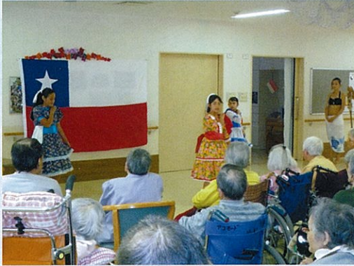
◀ チリの子どもたちによる踊り。皆さん子どもを見ると自然に表情が和みます。衣装もとてもかわいかったですね。