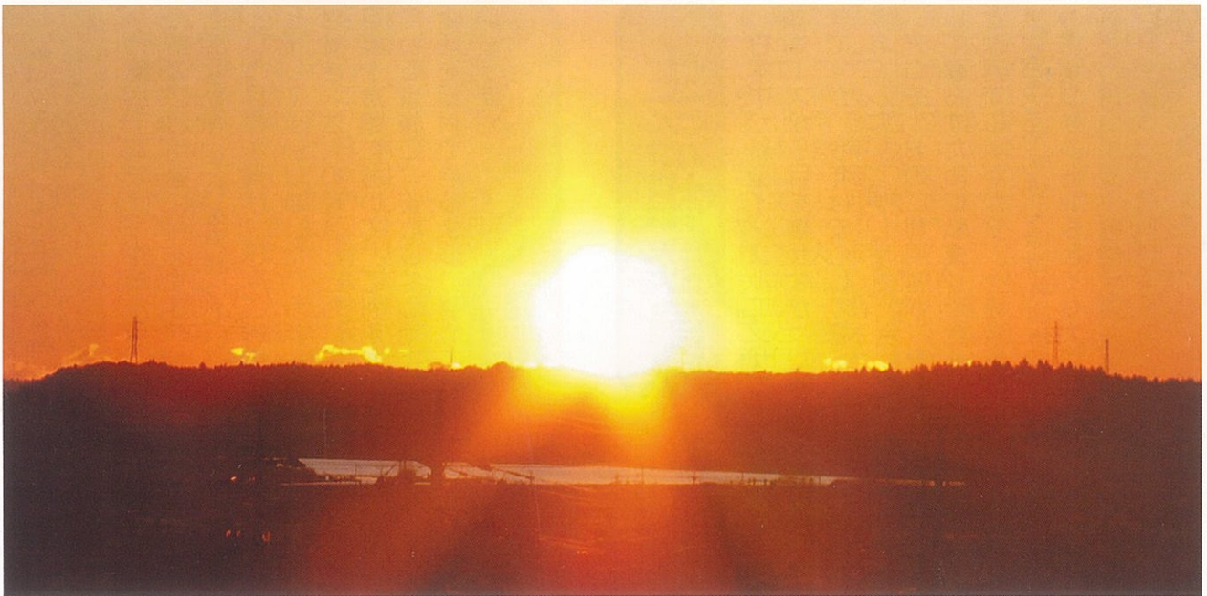
2010年の初日の出です。アコモードの屋上から撮影しました。