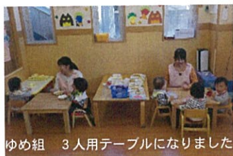
ゆめ組 3人用テーブルになりました