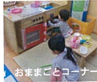
おままごとコーナー