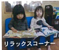
リラックスコーナー