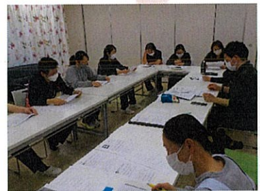
研修の最後にグループワークを実施！ 率直な意見を交わしました