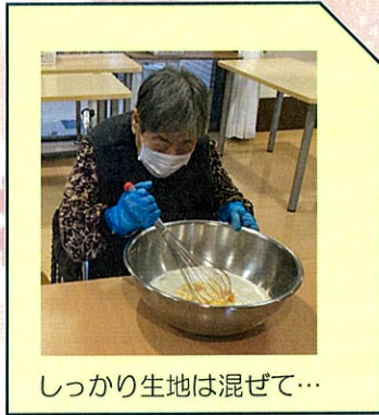
しっかり生地は混ぜて…