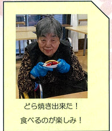
どら焼き出来た！ 食べるのが楽しみ！