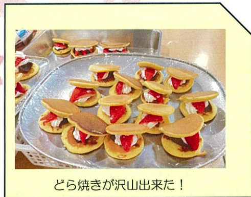
どら焼きが沢山出来た！