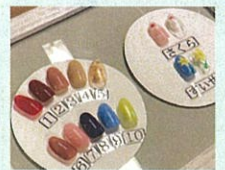
何色で何の絵にしようかな~?