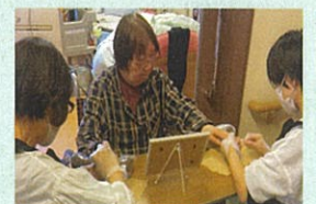
どんな感じになるか ワクワク!