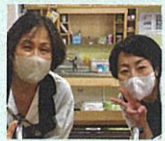
ネイリストのロイ職員と浅海職員。