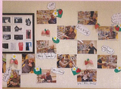
壁にもイチゴ狩りの写真を貼っています!ご面会時にぜひご覧ください。