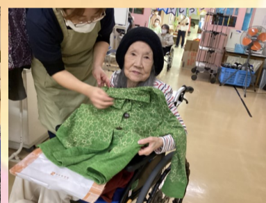
お似合いですお客様