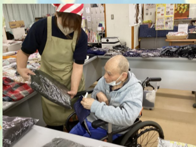
これにしようかな

少し寒くなってきた事もあり「レッグウォーマーが欲しかった」や「ゆったりした靴下がいい」などの声もありました。皆さんの希望も取り入れながら、またお買い物イベントができればいいなと考えています。