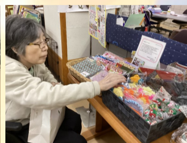
何があるのかしら