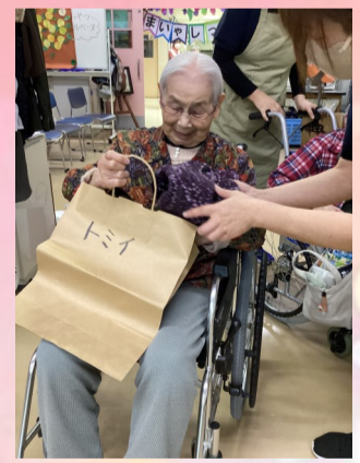
ありがとうございます