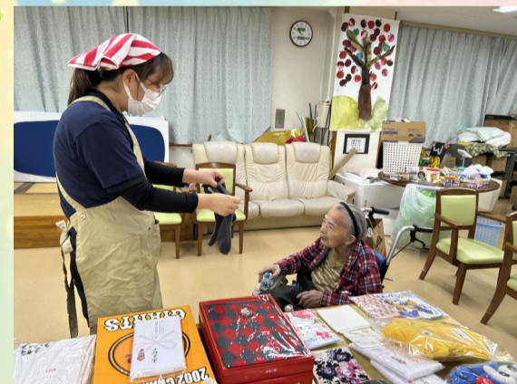
こちらはいかがですか？