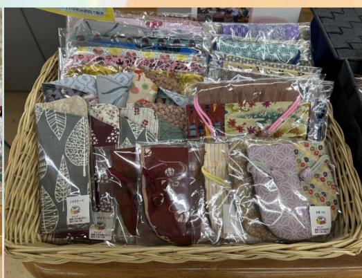
ミニ巾着や眼鏡ケース、ポーチなどかわいい布小物です

『ウイング』様より寄付していただいた布小物がたくさんです！素敵な巾着やポーチ、アクリルタワシは可愛らしくて飾りにもなってしまいそう。眼鏡ケースなど実用的な物から、ラベンダーがたっぷり詰まった香り袋までありました。ぜひお店の方にも足を運んでみてください。