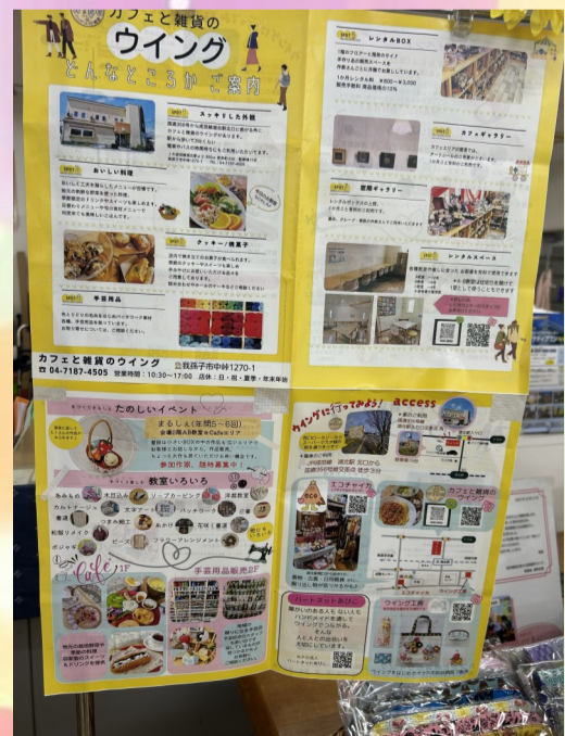
カフェと雑貨の「ウイング」