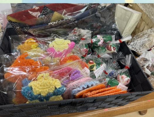
アクリルたわしやイチゴ型ポフ、ラベンダーのいい香りです！