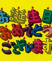
武内 静枝様 86歳