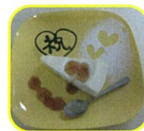
お祝いのケーキです！