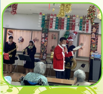
旭田職員進行で笑いもあり盛り上がりました (≥▽≤)笑