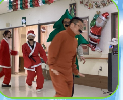
職員による皿回し&バケツ回しです (*~v)