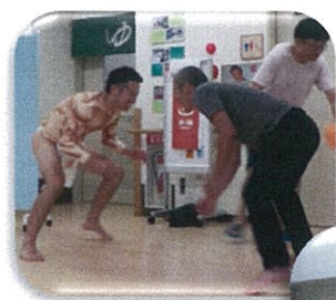
↓根本職員腰痛を感じさせない投げ技!