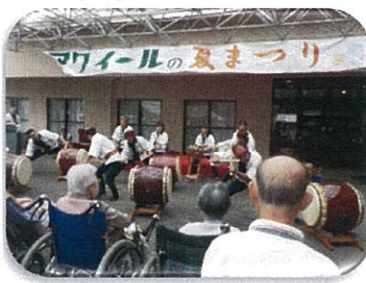
迫力の太鼓! 心臓まで響きました!