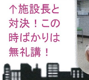
↑施設長と対決! この時ばかりは無礼講!