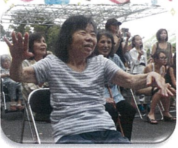
コンサートでノリノリです♪

毎年恒例の呼魂太鼓や、柏市民吹奏楽団等迫力の演奏あり、歌手になった元アキール職員のコンサートあり、綺麗な女性によるフラダンス(珍しく若い女性でした☆)あり、夏らしく盆踊りありの、バラエティに富んだ演目の中から見たい物があれば見に行ったり、バザーや屋台で面白い物したりとお祭りの雰囲気味わって頂きました。