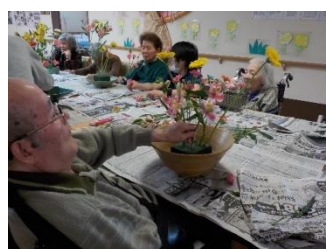
生け花をされている様子。花器はご家族からいただきました。