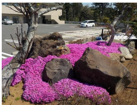
アクイールの駐車場わきにある芝桜も満開に。藤色や白など色鮮やかです。この時期にお散歩される際はぜひご鑑賞ください。

車椅子の方の移動を手伝われている、微笑ましい一瞬です。足元はでこぼこしているので転ばないように注意して歩いています。