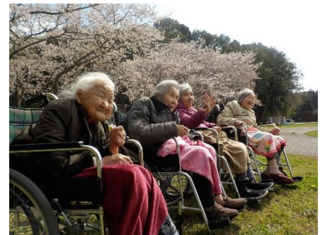
春風が吹く中でのお花見。遠い位置から桜並木を鑑賞。気候が穏やかとはいえ、風が強いので防寒もしっかりと行いました。