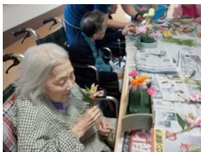
思い思いにいけるご入居者。

これからもご入居者の趣向に合わせた余暇活動を企画していきますので、ご希望があればいつでも仰って下さい。