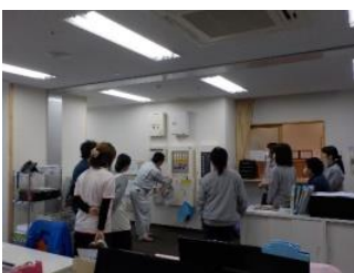
事務所にて。通報訓練の様子。