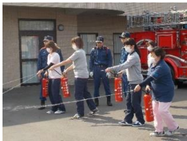
隊員のレクチャーを受ける職員。

いただき、水消火器を使用した消火訓練も行いました。プロに指導していただいたことで、職員の自信に繋がったと思います。この他にも、自然災害想定