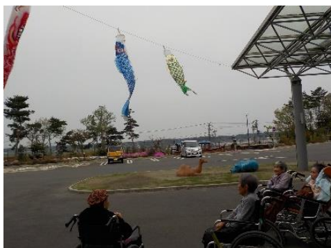
お散歩中に、玄関前に泳いでいる鯉のぼりを見上げるご入居者。鯉のぼりは毎年飾り付けています。