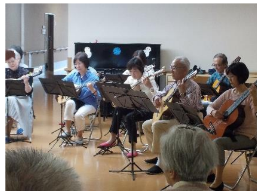
演奏する「ドルチェマンドリーノ」の皆さま。

まれる方もいました。終わった後も歌詞カードを持たれていて、後から何度も見て楽しまれてらっしゃる方も。