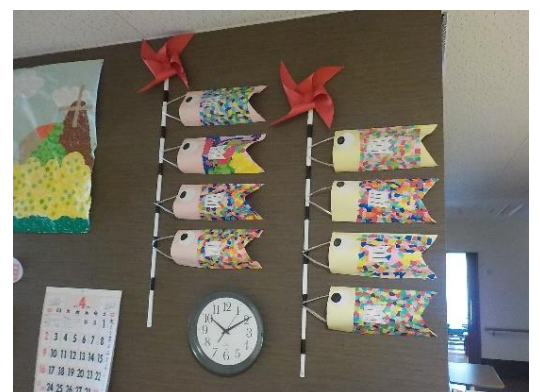
ユニットの壁面装飾にも鯉のぼりが。カラフルな鱗の部分はご入居者と一緒につくりました。