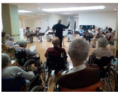
近い位置で迫力の演奏を聴き入るご入居者。