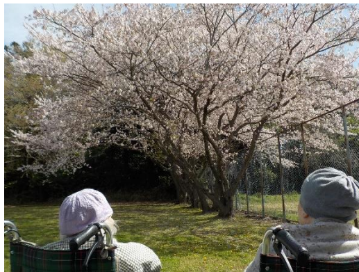
見事な桜の木を見上げるご入居者。前日は雨が降ったので沢山散ってしまうかと心配されましたが、まだまだ力強く花を咲かせていました。