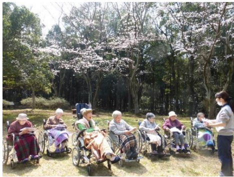
ユニットの皆さんで五本松公園に行ってきました。心地よい陽気の中で、歌をうたう皆さん。

4月に入り、気候も少し穏やかになってきた頃、ユニットや多床室でそれぞれ、お花見やお散歩に出かけました。歩いて5分程の場所にある五本松公園や、車で7～8分走ったところにある川村女子学園に行き、桜の鑑賞を楽しまれました。また、4月の上旬にはアクイールでも鯉のぼりを飾り付けたので、駐車場脇の芝桜とともにご入居者がお散歩をした際の鑑賞スポットになっています。