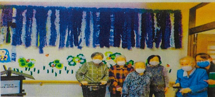
お花紙で藤の花、折り紙でシロツメクサを作り、折り紙のテントウムシを添えました。クローバーやテントウムシを添えたことで、鮮やかな藤棚の壁画が出来上がりました。

2021年に皆さんで制作していただいた藤棚の壁画が、デイサービスの専用雑誌「月刊デイ」に掲載されました。今後も四季を感じられる作品を、楽しみながら制作していきましょう。