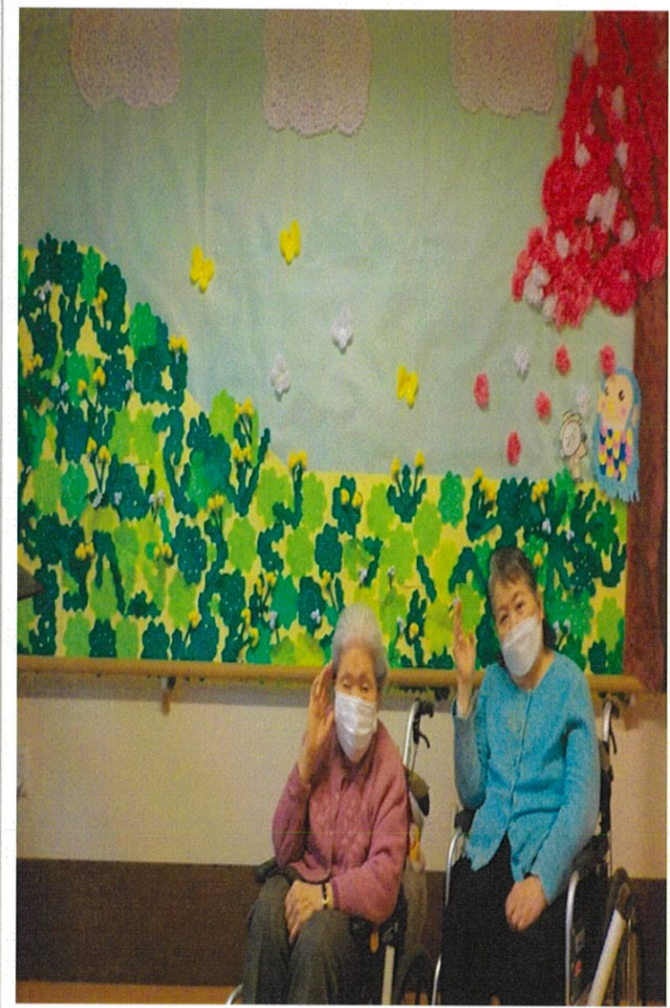
特別養護老人ホーム アクイール デイサービスセンター様(千葉県我孫子市)