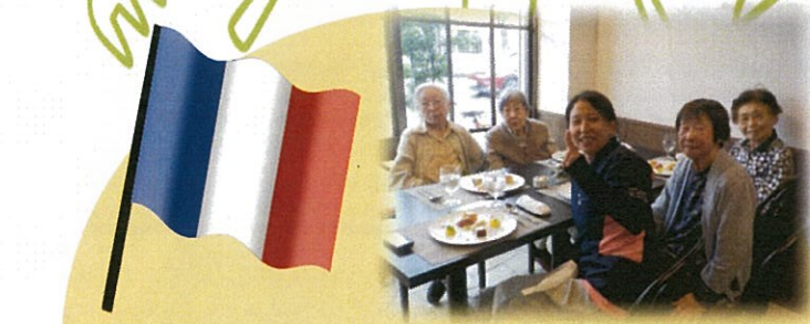
フレンチ女子会。普段よりも上品に召し上がりました