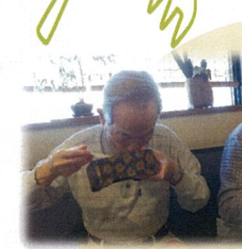
今年のウナギは3千7百円でもやっぱり美味しかった。みんなキレイに完食でした。