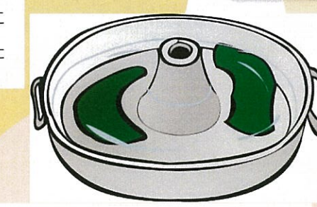
ぐうぜんにもしゃぶしゃぶ祭りで、盛りだくさんのお肉。すぐにお肉が無くなりましたね。