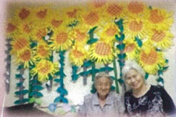
ひまわりが壁面に満開に咲きました♡