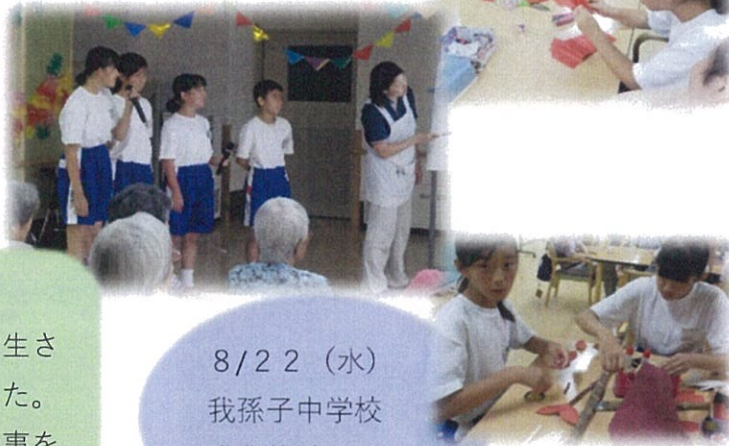
8/22 (水) 我孫子中学校職業体験。

8月の壁面製作は【彼岸花】作りを行いました。花びら一枚一枚、鉛筆でくるくる跡をつけてきれいに巻きました。