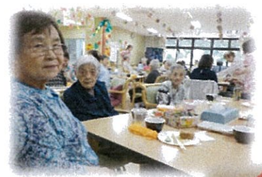
ハッピーフラさんによるフラダンス