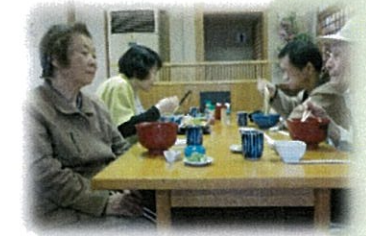
温かいものはホッとしますね。 職員以外は皆さん温麺でした。