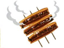
今年は高かった。けど、やっぱり上手かった・・・高くて年一度は食べたいです。