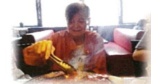
ランチなので1000円前後でおいしい焼肉が食べられました♡