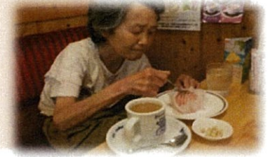
コーヒーとケーキのセットを楽しみました。3人で仲良く女子会してきましたよ。