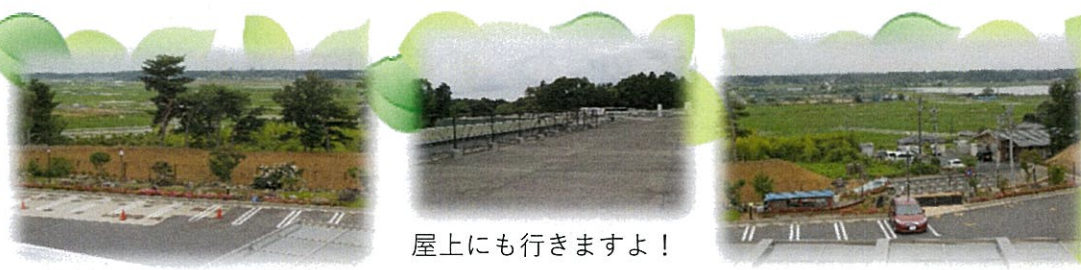
屋上にも行きますよ！ 眺めは抜群です。