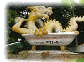
「ようこそアキールへ」名物の龍がお出迎えます。