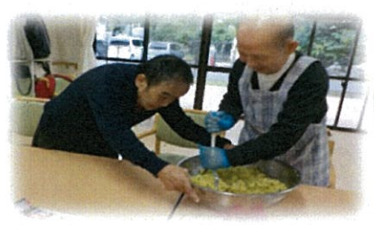
力仕事はやっぱり頼りになりますね。