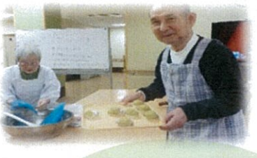
コロコロ・・・大ききの違うスイートポテトが沢山できました。