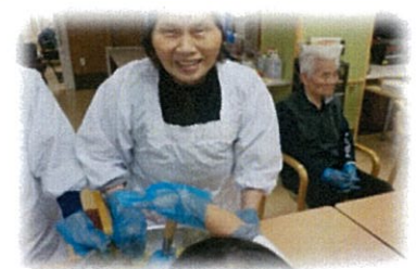
女性陣は本当に手際がよくさすが!!って、驚かされました。