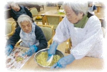
割烹着姿がとってもお似合いです♡